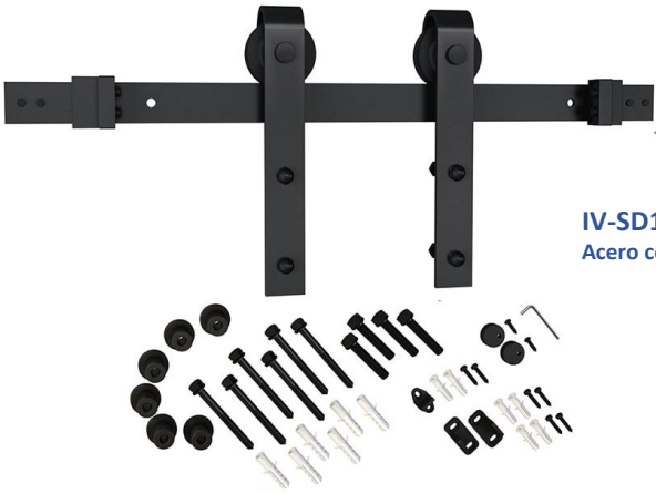
IV-SD10AD-622 Acero color Negro