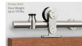
Pemko W50 Door Weight: up to 176 lbs.