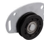
D-H-3951 KIT riel a piso