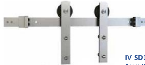
IV-SD10AD-630 Acero INOXIDABLE