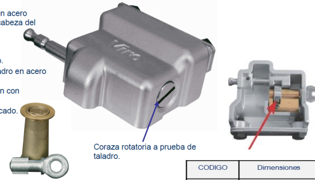
Coraza rotatoria a prueba de taladro.

Video instalación: https://www.youtube.com/watch?v=A5m3w1PMBps&index=8&list=PL712254C3BB4A65B5