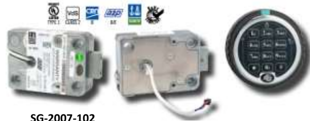
SG-2007-102 Cerradura y teclado giratorio