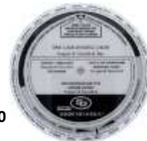
Tarjeta de programación del reloj (winding chart)