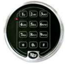
SG-6123-61KP Cerradura y teclado